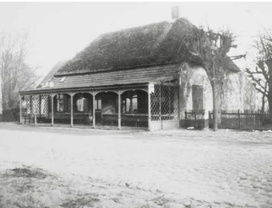
De Bult in 1925, de locatie aan de Boterweg waar Vitesse in 1894 tegen Victoria de eerste competitiewedstrijd speelde

Vitesse beëindigde de competitie in 1895, met slechts vier tegenstanders, als kampioen. Victoria werd hekkensluiter. Puntloos met acht wedstrijden en het doelsaldo 0-67. In 1902 werd Victoria opgeheven omdat veel leden zich hadden aangesloten bij Wilhelmina, een van de voorlopers van FC Den Bosch.